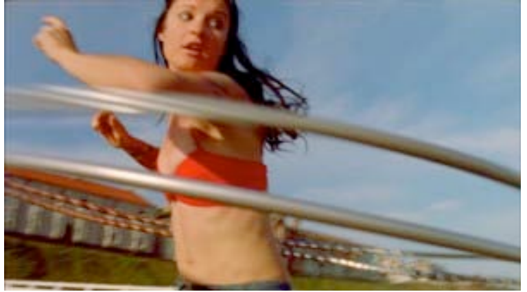
« DV8 : the cost of Living » de Lloyd Newson (UK)